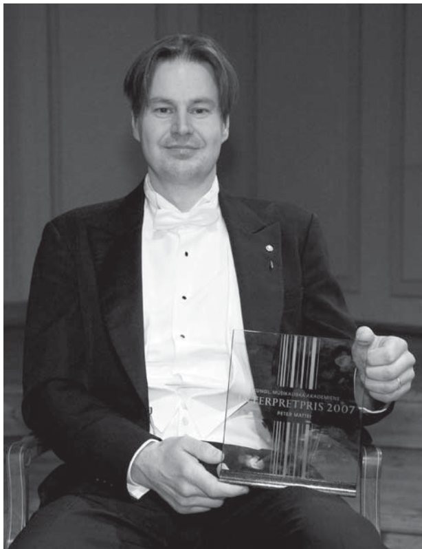
Hovsångaren Peter Mattei mottog Kungl. Musikaliska Akademiens nyinstittade Interpretpris.

över Peter. Hans röst, hans person och hans sceniska utstrålning sammansmälter till en norrländsk lava som formligen väller ut ur honom. Hans scenperson utstrålar en enorm, alldeles spontan glädje över att bara vara, att öppna munnen och få sjunga och agera. I Peters fall betyder ordet »interpretera« att göra musik och text till något helt eget, något högst personligt som till synes föds i ögonblicket. Av tekniskt beräkande märks ingenting.